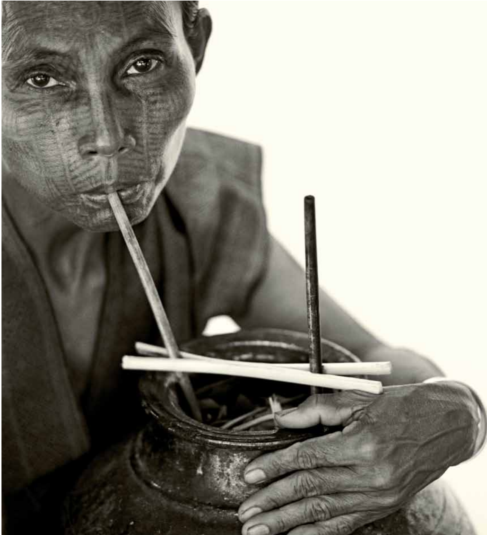
ÖNCEKİ SAYFA: PIPO İÇMEK CHIN KABİLESİ İNSANLARI ARASINDA YAYGIN BİR ALIŞKANLIK. SOLDA: CHAUNG NET KÖYÜNDEN BİR LAYTU CHIN KADINI, PİRİNÇ LİKÖRÜ SAKLAMAK İÇİN KULLANILAN KÜPTEN LİKÖR İÇİYOR. ÜSTTE SAĞDA: GÜNEY CHIN EYALETİNDEN BİR DAI CHIN KADINI. SAĞDA: LAYTU CHIN'IN ÖRÜMCEK AĞI ŞEKLİNDEKİ DESENLERİ, TÜM DÖVMELER ARASINDA BELKİ DE EN GÜZELLERİ. AMA TABİİ BU DÜŞÜNCEMİZ, BİZİM "STANDART BATILI SOSYOKÜLTÜREL ŞARTLANMAMIZIN" BİR GÖSTERGESİ DE OLABİLİR.